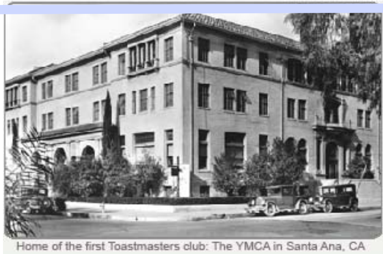
Home of the first Toastmasters club: The YMCA in Santa Ana, CA